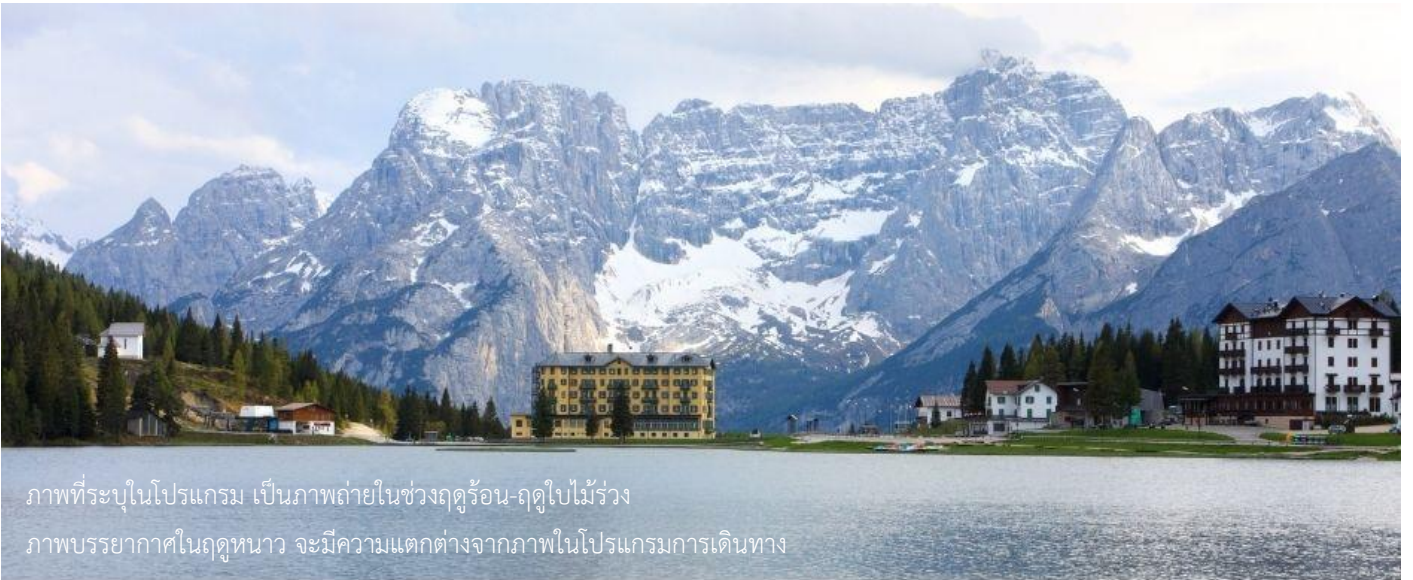
ภาพที่ระบุในโปรแกรม เป็นภาพถ่ายในช่วงฤดูร้อน-ฤดูใบไม้ร่วง ภาพบรรยากาศในฤดูหนาว จะมีความแตกต่างจากภาพในโปรแกรมการเดินทาง