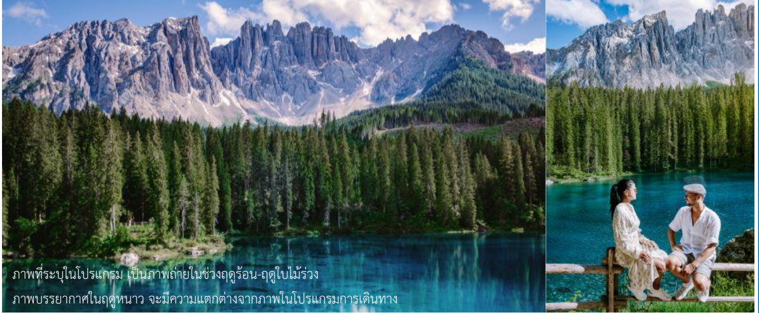
ภาพที่ระบุในโปรแกรม เป็นภาพถ่ายในช่วงฤดูร้อน-ฤดูใบไม้ร่วง ภาพบรรยากาศในฤดูหนาว จะมีความแตกต่างจากภาพในโปรแกรมการเดินทาง

มองเห็นได้อย่างชัดเจนจากทุกมุมมอง ท่านจะได้ชมความงามของภูเขา Dolomites ซึ่งได้รับการขึ้นทะเบียนเป็นมรดกโลกจากยูเนสโก ถึงเวลาอันสามครรนำท่านเดินทางกลับลงมาที่ตัวเมืองออดิเซ่