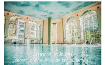
บรรยากาศของบ่อน้ำแร่ อาจจะแตกต่างกันไปตามแต่ละโรงแรมที่เข้าพัก