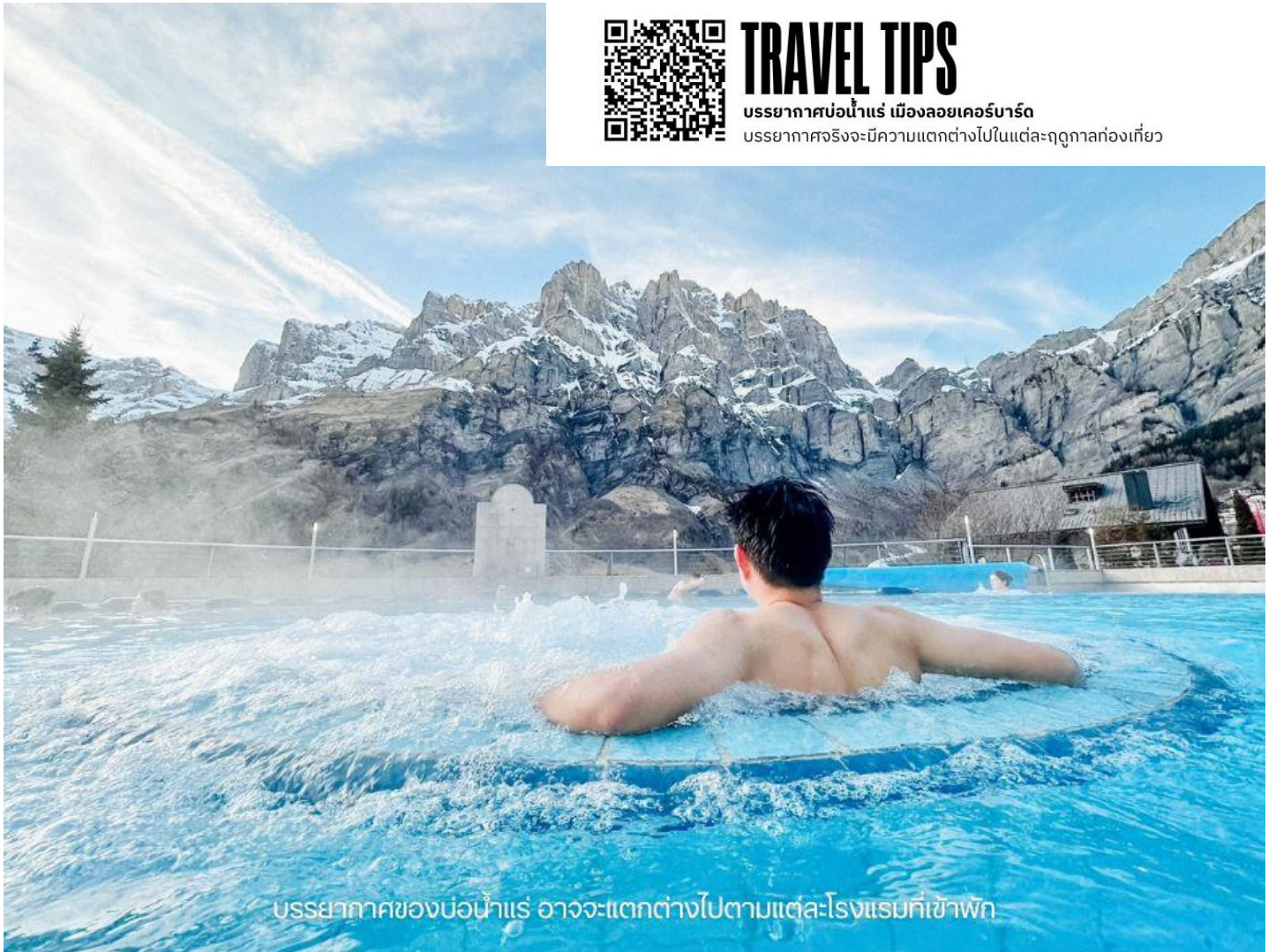
บรรยากาศของบ่อน้ำแร่ อาจจะแตกต่างกันไปตามแต่ละโรงแรมที่เข้าพัก

บรรยากาศจริงจะมีความแตกต่างไปในแต่ละฤดูกาลท่องเที่ยว