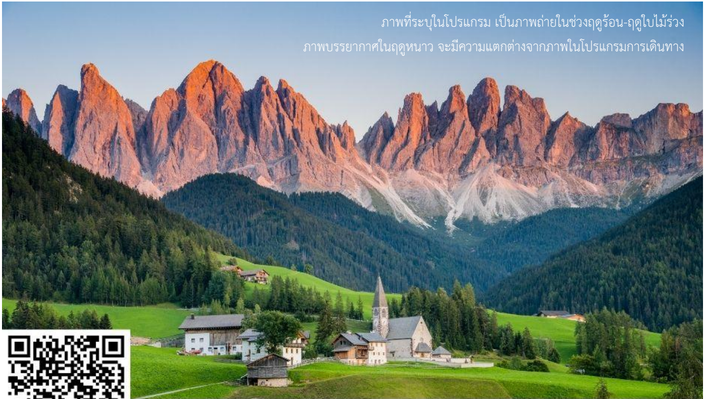
ภาพที่ระบุในโปรแกรม เป็นภาพถ่ายในช่วงฤดูร้อน-ฤดูใบไม้ร่วง ภาพบรรยากาศในฤดูหนาว จะมีความแตกต่างจากภาพในโปรแกรมการเดินทาง

จากนั้นนำท่านเดินทางสู่ ชุมชน Val di Funes ชุมชนเล็กๆ ทางภาคตะวันตกของอุทยานโดโลไมต์ ประกอบด้วยหมู่บ้านเล็กๆ 6 หมู่บ้าน โดยมีชื่อเสียงจากการมีวิวทิวทัศน์ที่สวยงามที่สุดในเขต South Tyrol อีสระให้ท่านเก็บภาพความประทับใจ จากนั้นนำท่านเก็บภาพความประทับใจอีกหนึ่งสถานที่ ณ โบสถ์ Santa Maddalena โบสถ์ที่ถือเป็นสถานที่ไฮไลท์ที่ถูกล่ามรดกมากที่สุดในอุทยานโดโลไมต์ มีวิวทิวทัศน์ที่สวยงามมีฉากหลังเป็นเทือกเขา Odles (การเดินทางขึ้นไปเก็บภาพความประทับใจนี้ ท่านจะต้องเดินขึ้นลงเนินไปและกลับประมาณ 2 กิโลเมตร เพื่อไปเก็บภาพ)